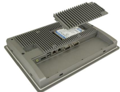
Доступ к SSD / HDD